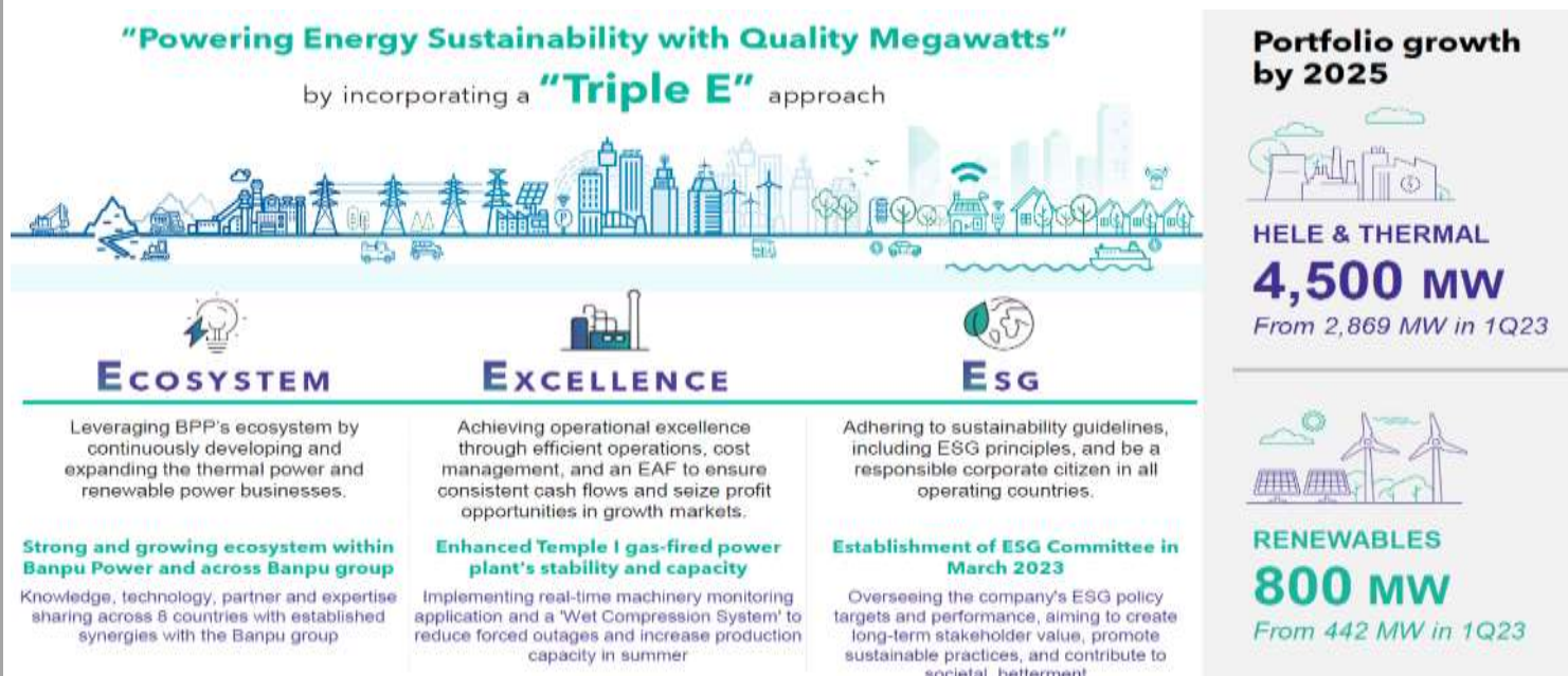
Fig 2: BANPU group's 2025E power generation target